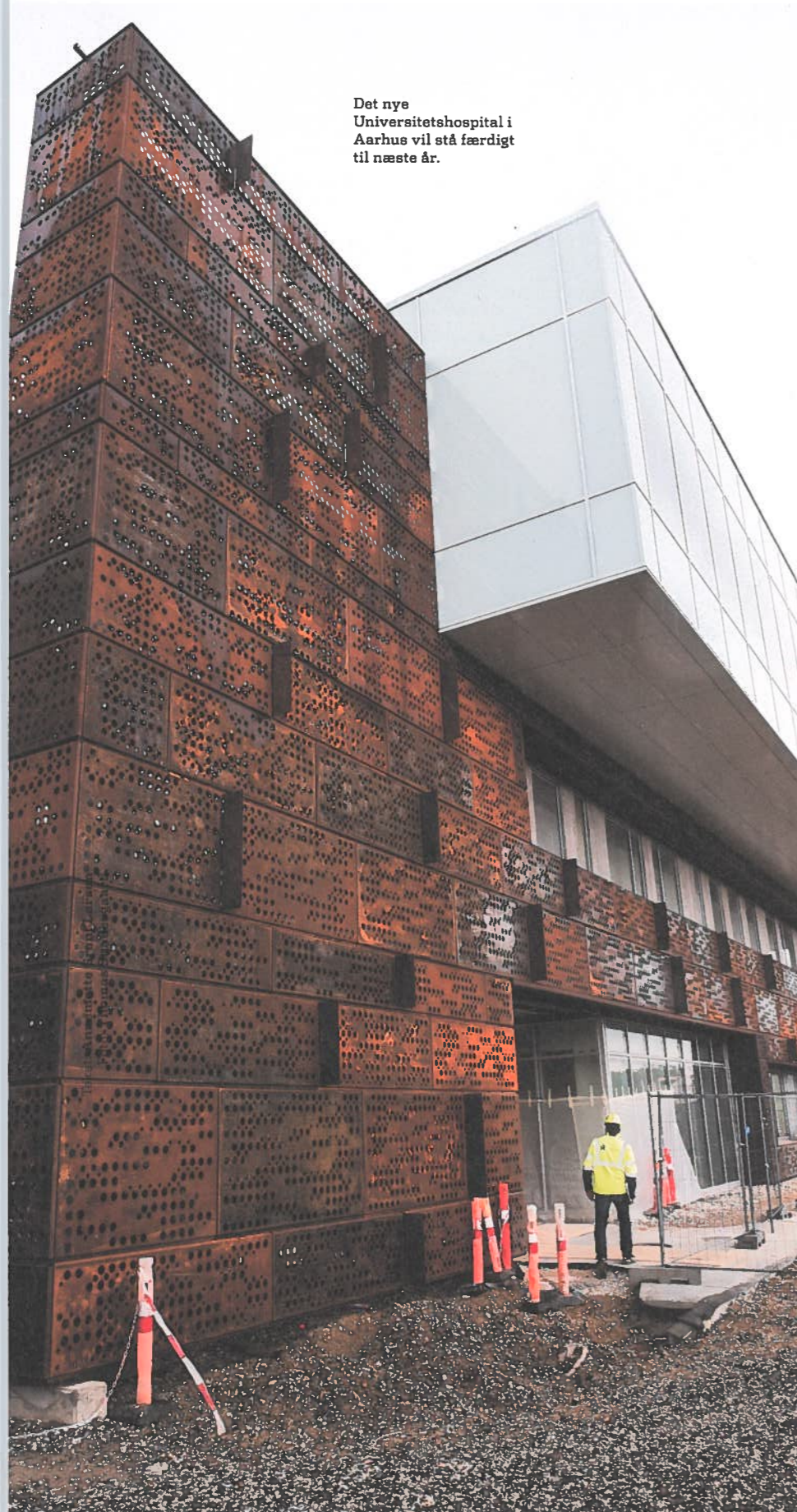
Det nye Universitetshospital i Aarhus vil stå færdigt til næste år.